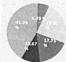
Primárne zdroje (Obnoviteľné zdroje) za rok 2024